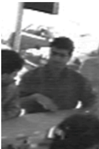
Uomini non identificati

Sospettato/i Sconosciuto/i Panama 19 luglio 1994