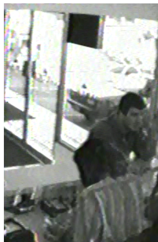
Uomo non identificato