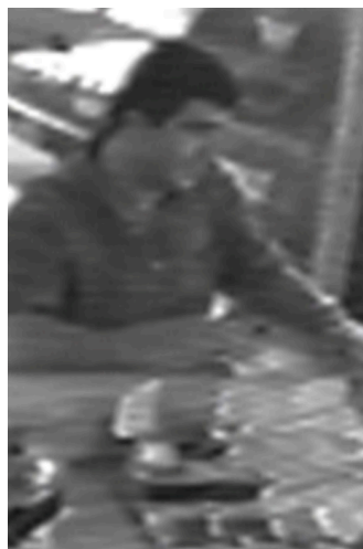
Uomo non identificato